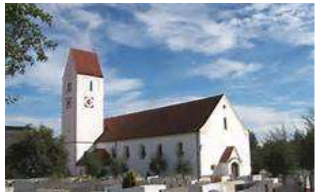
Pfarramt St. Elisabeth Kirchdorf