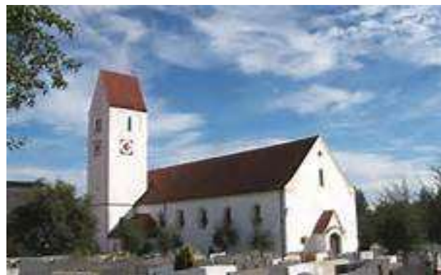
Pfarramt St. Elisabeth Kirchdorf