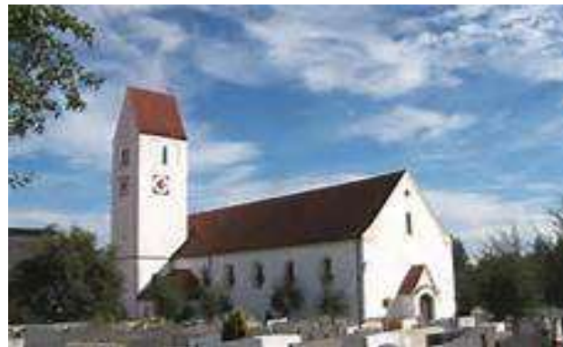
Pfarramt St. Elisabeth Kirchdorf